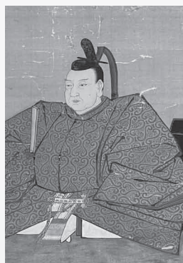
坪内定堅像 (瑞眼寺蔵)