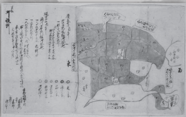
坂井村絵図(永田家文書)