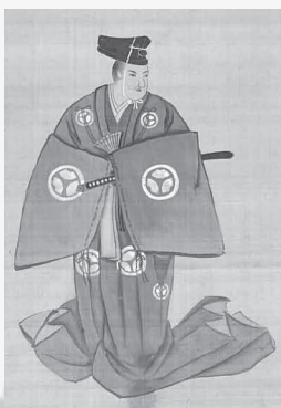
徳山秀堅像 (横山信治氏蔵)

江戸時代の各務原はどのような地域だったのか、御膳粉はどのように作られ、どのようにに将軍のもとに届けられたのか、各務原の村々に残されたたくさんのお古文書から紐解きます。