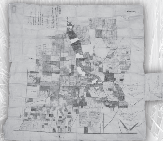
野口村絵図(安積家文書)