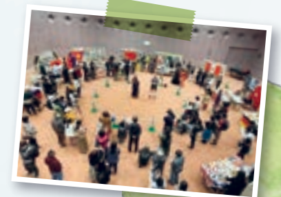
KIA Festival 2020的活动情景