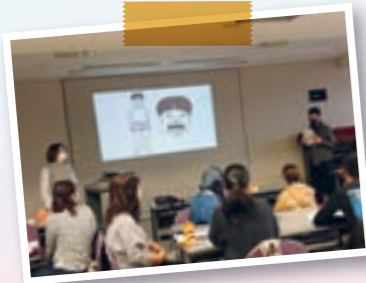
※にほんごきょうしつ