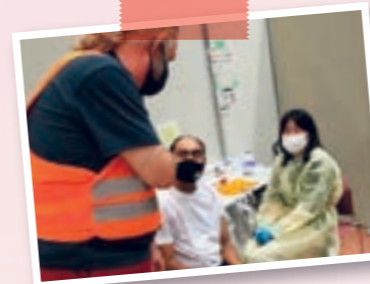
※ワクチンを うつときの つうやく