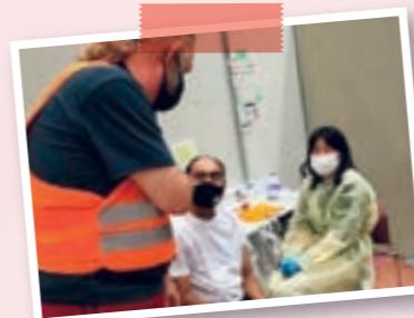
* Vacinação para estrangeiros