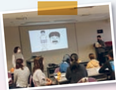
* Aula de japonês