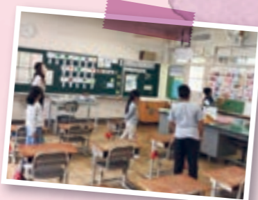
* Sala "FUTURO" (Sala de aula de japonês básico)