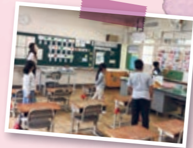
※ Lớp tiếng nhật kỳ đầu tiên (lớp học Futuro)