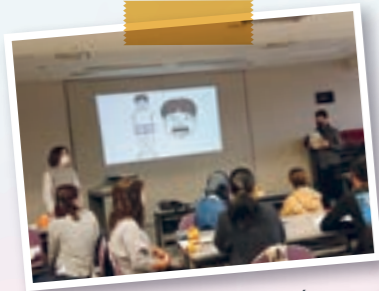
※ Lớp học tiếng Nhật