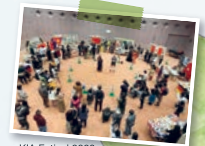
※ KIA Festival 2020