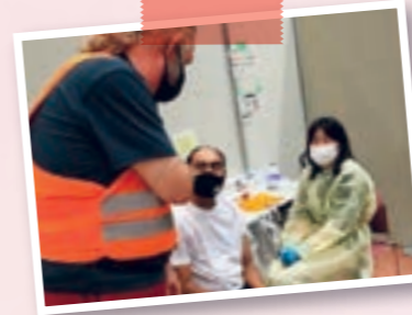
※ Ngày người nước ngoài tiêm vaccine Hình ảnh đang thông dịch