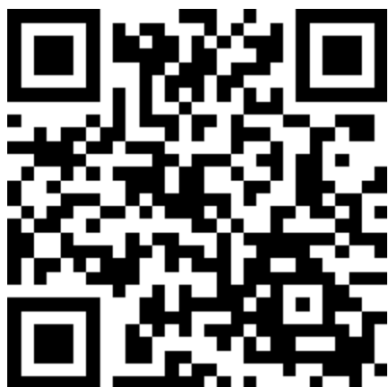
事前登録用二次元コード