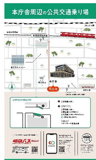
デジタルサイネージ