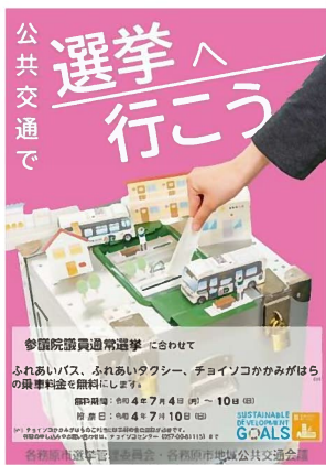
選挙無料キャンペーン