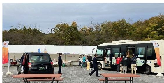
おさんぽマルシェでの出展