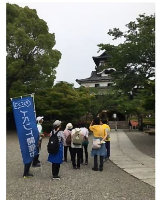
チョイソコイベントの様子