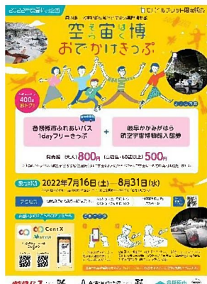
デジタルチケット