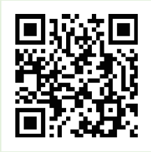
▲ 参加申し込みフォーム