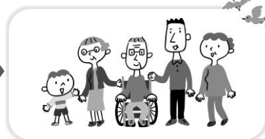
みんなで協力して解決！