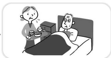
ひとりの力では解決できない！