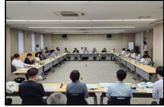
市民ワークショップの様子(左:中学生の部・中:高校生×大学生の部・右:一般の部)