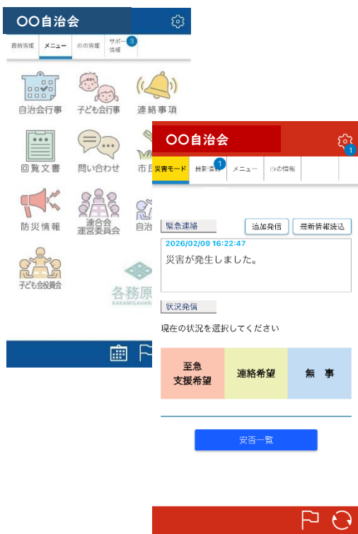
災害時安否確認画面一例