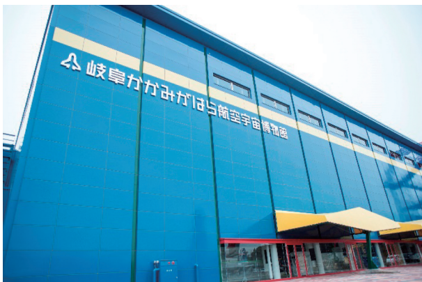
岐阜かかみがはら航空宇宙博物館

「ものづくりのまち」という市の特性を活かした、国内最大級の「航空」と「宇宙」に関する専門博物館です(愛称:空宙博 そらはく )。敷地内には、41機の実機と15機の実物大模型を展示しており、国内に1機しか現存しない飛燕の実機展示や、航空シミュレーターによる操縦体験、国際宇宙ステーション(ISS)日本実験棟「きぼう」の実寸大模型など見どころがいっぱいです。「空・宇宙への挑み～かかみがはらから日本へ、そして世界へ～」をコンセプトに、先人の空・宇宙への憧れ、挑戦の物語を伝え、子どもたちにチャレンジスピリットと感動を与える博物館です。