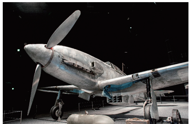
三式戦闘機二型「飛燕」