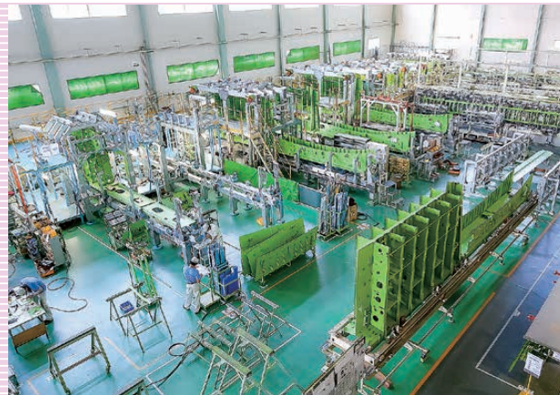
関工場 航空機部品組立職場