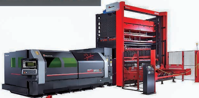
各務原工場 ファイバーレーザー加工機