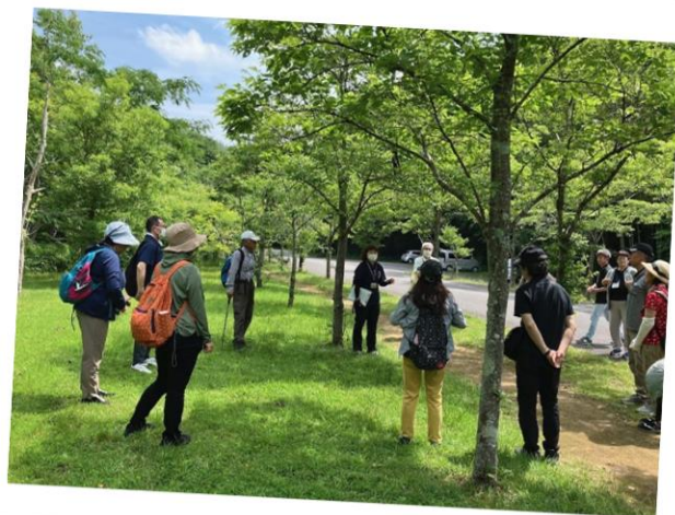
各務野自然遺産の森で体を動かしました