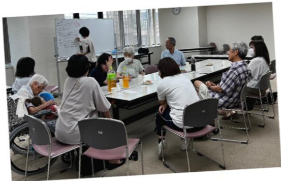
ミーティングの様子