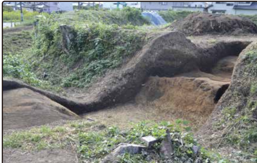
①～④・⑧ 土塁の急勾配な斜面（写真：②）

戦国時代、平地の居館には外敵を防ぐために土塁が築かれるようになります。本遺跡の土塁を見ると、絶壁のような急勾配であり、土を盛り上げた後に斜面を削り出していることが分かります。しかし、土塁の構築において、“斜面を削り出す”という工程はなく、斜面の勾配はもう少しなだらかであることが一般的です。つまり、土塁が築かれた当初の姿は現在とは違うのではないかと考えられます。戦国時代以降に土塁の斜面を急勾配にする、土をさらに盛り上げるなどの改修が加えられたことが推測できます。