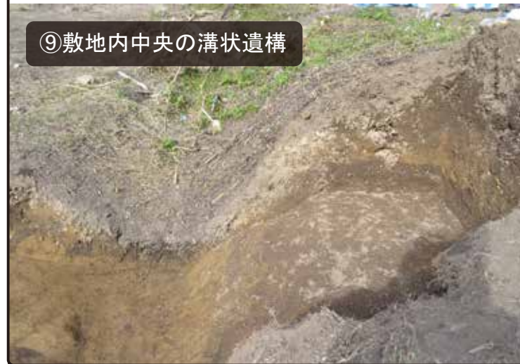
⑨敷地内中央の溝状遺構