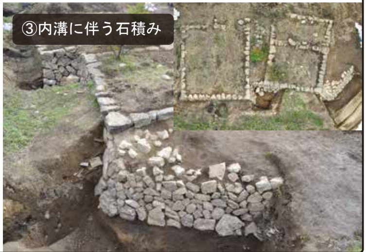
③内溝に伴う石積み