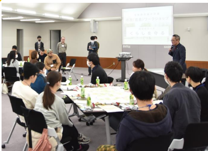
ヤングミーティング事業