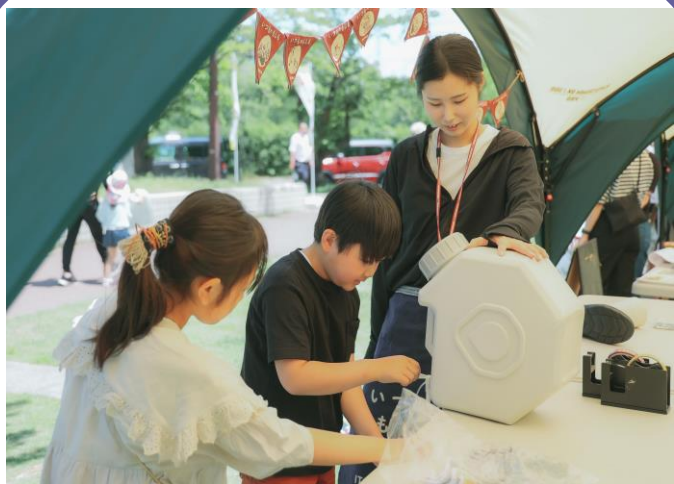
防災啓発イベント事業