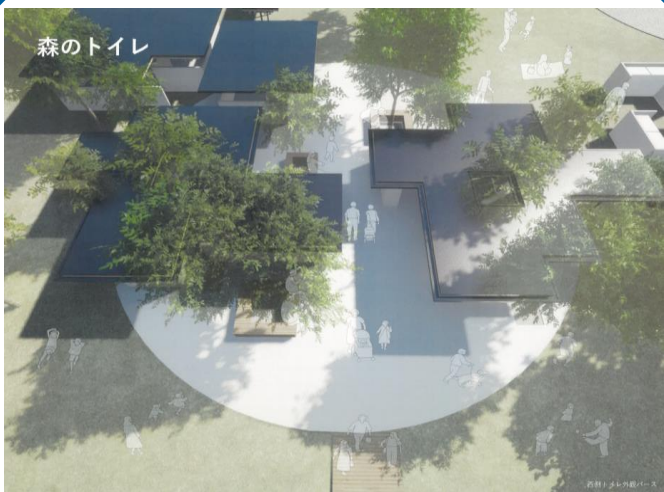
市民公園等利活用事業