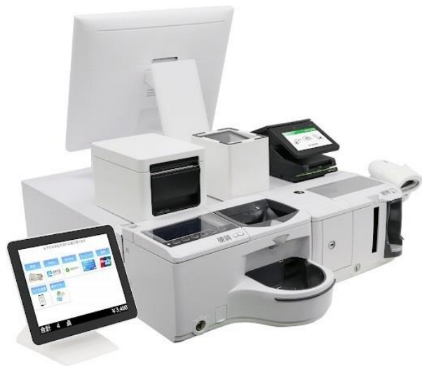
セミセルフレジ導入事業