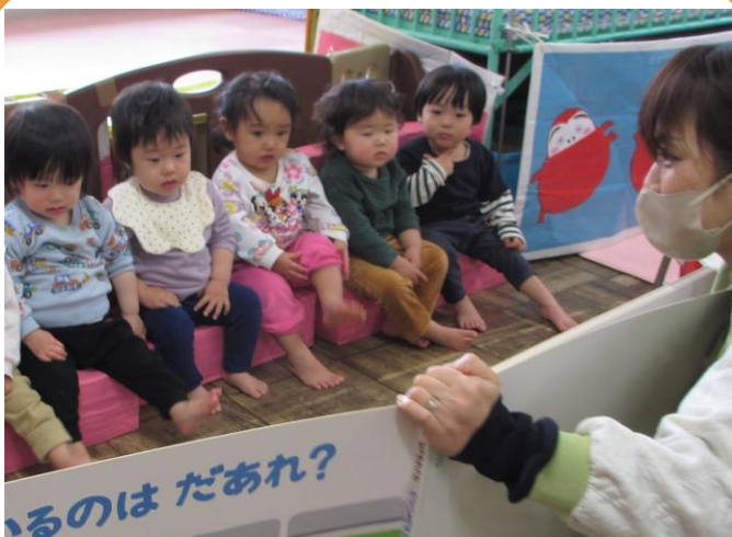
こども誰でも通園制度運営事業