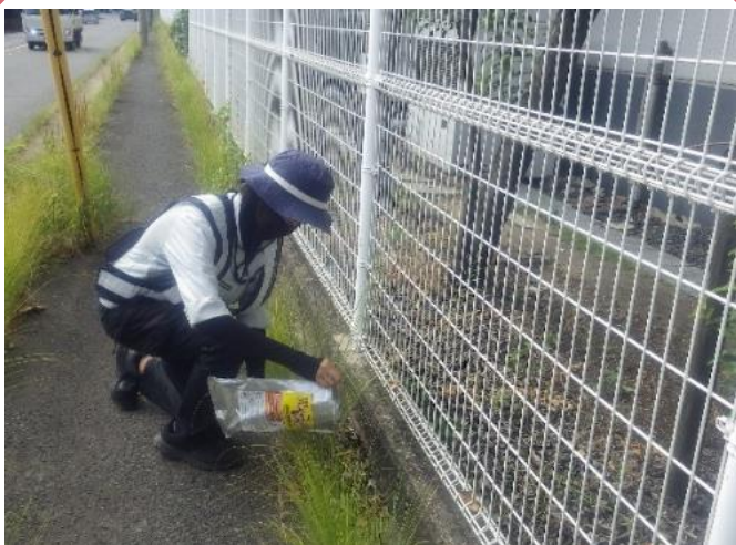
アルゼンチンアリ防除事業