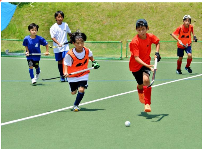
ホッケー王国かかみがはら推進事業