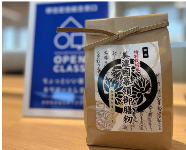
御膳粉ブランド化推進事業