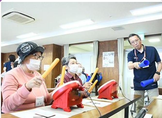
eスポーツを活用したフレイル予防事業