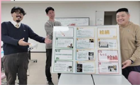
写真は過去の事業参加者の様子です