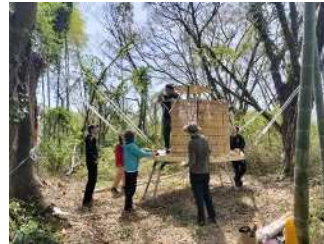
ツリーハウス制作ワークショップ

「制作・展示・撤去・素材の再利用」という一連の流れを事業の枠組みとして、年間を通して実施しました。本年度は、その循環型の取り組みをかたちにする初年度として実施しました。