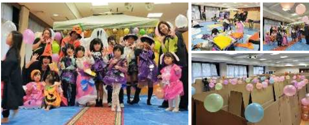
キッズブースターセッション