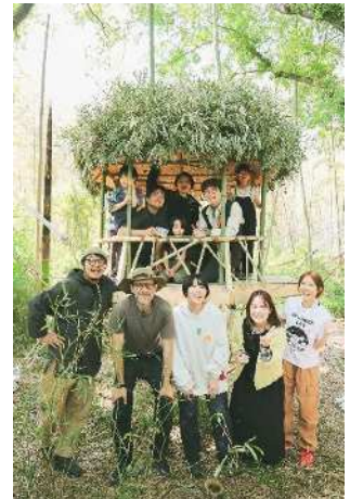
完成したツリーハウス