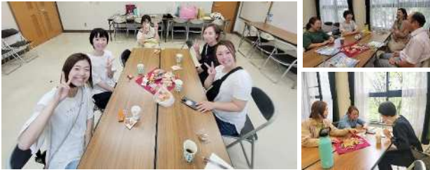
ウェルカムガーデンのようす