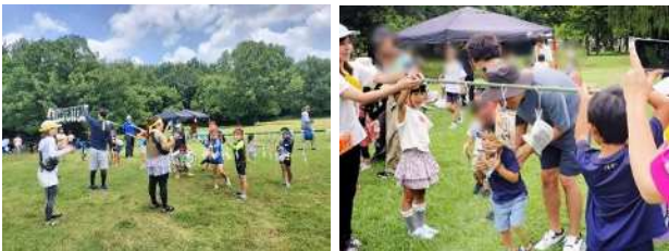
サマーブルーアドベンチャー