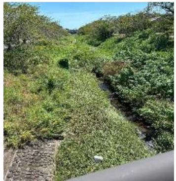
●除草作業 ①9月7日 ②9月14日 ●刈り倒した草を堤防へ上げる 9月28日 ●搬送 9月29日