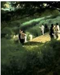
●河川巡視 ①5月14日 ②6月14日 ③7月15日 ④8月20日 ⑤9月24日 ●除草前の河川